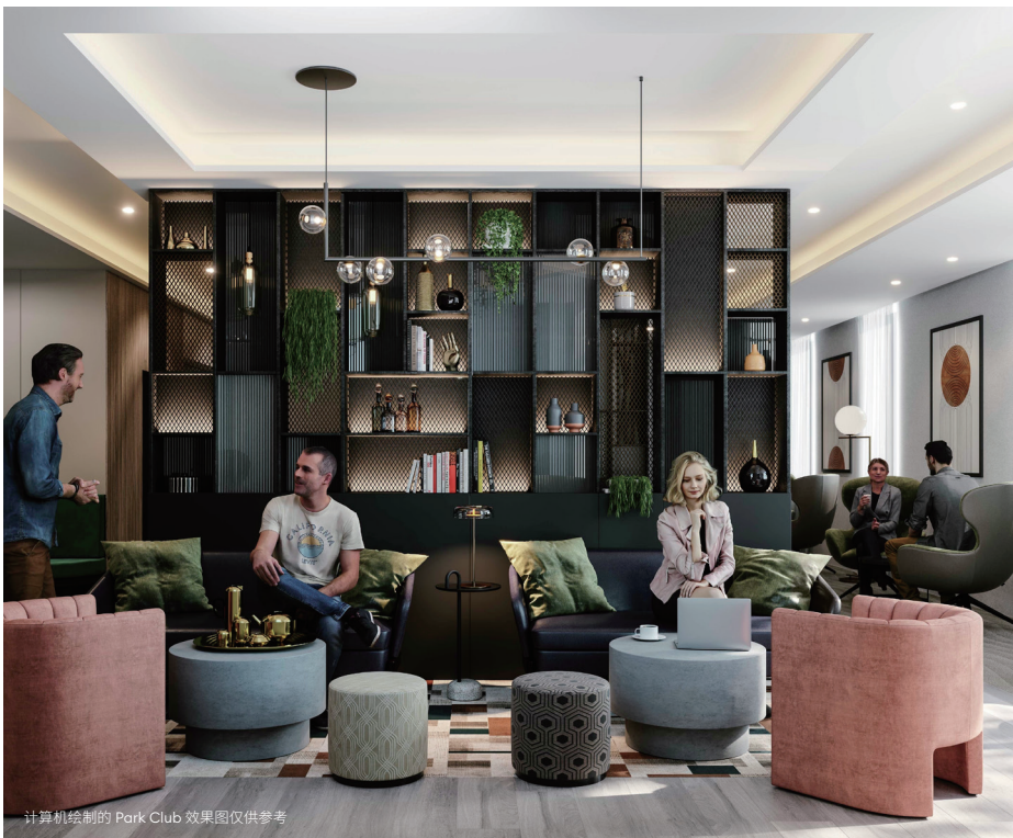
计算机绘制的 Park Club 效果图仅供参考