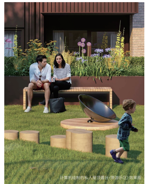
计算机绘制的私人屋顶露台(带游乐区)效果图