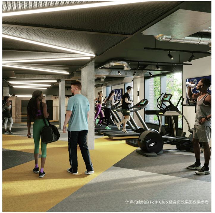
计算机绘制的 Park Club 健身房效果图仅供参考