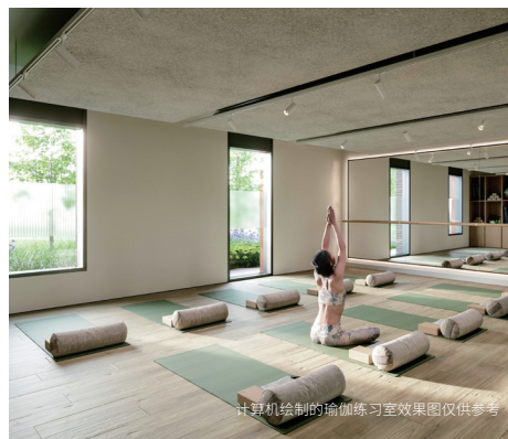
计算机绘制的瑜伽练习室效果图仅供参考

爱生活，爱自然，与都市田园为邻。定居 Moselle Gardens，不负韶华。