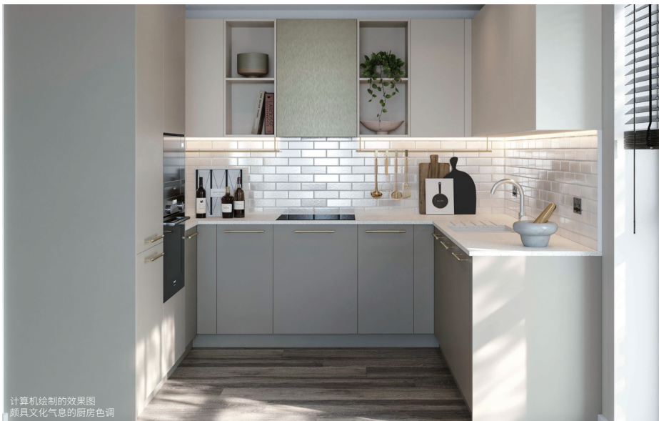
计算机绘制的效果图 颇具文化气息的厨房色调