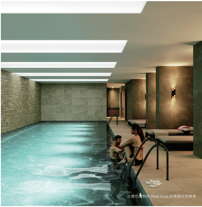
计算机绘制的 Park Club 效果图仅供参考