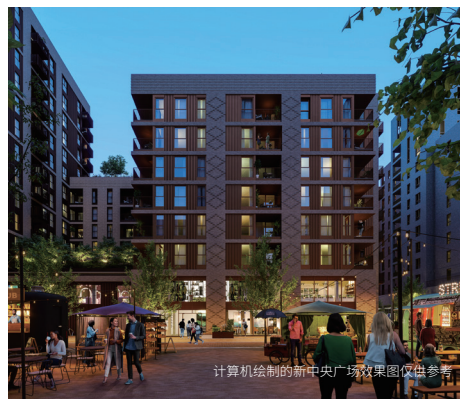
计算机绘制的新中央广场效果图仅供参考