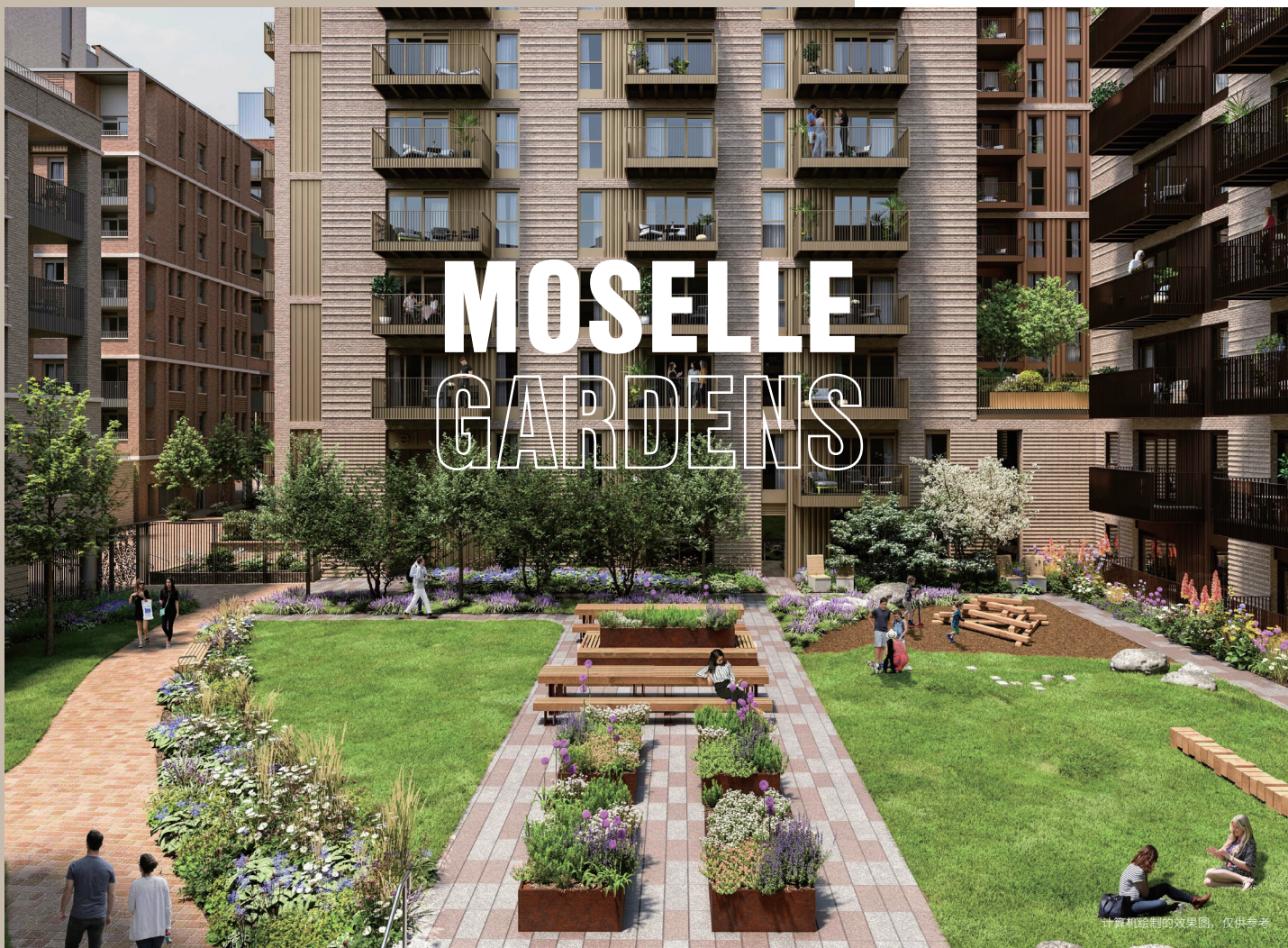
计算机绘制的效果图，仅供参考