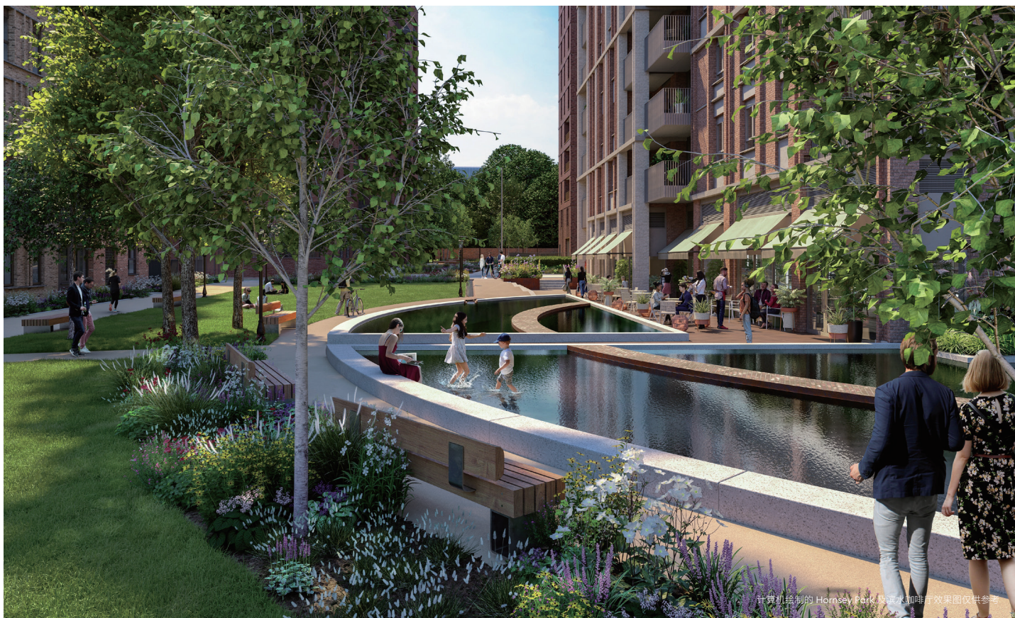
计算机绘制的 Hornsey Park 及诺水咖啡厅效果图仅供参考